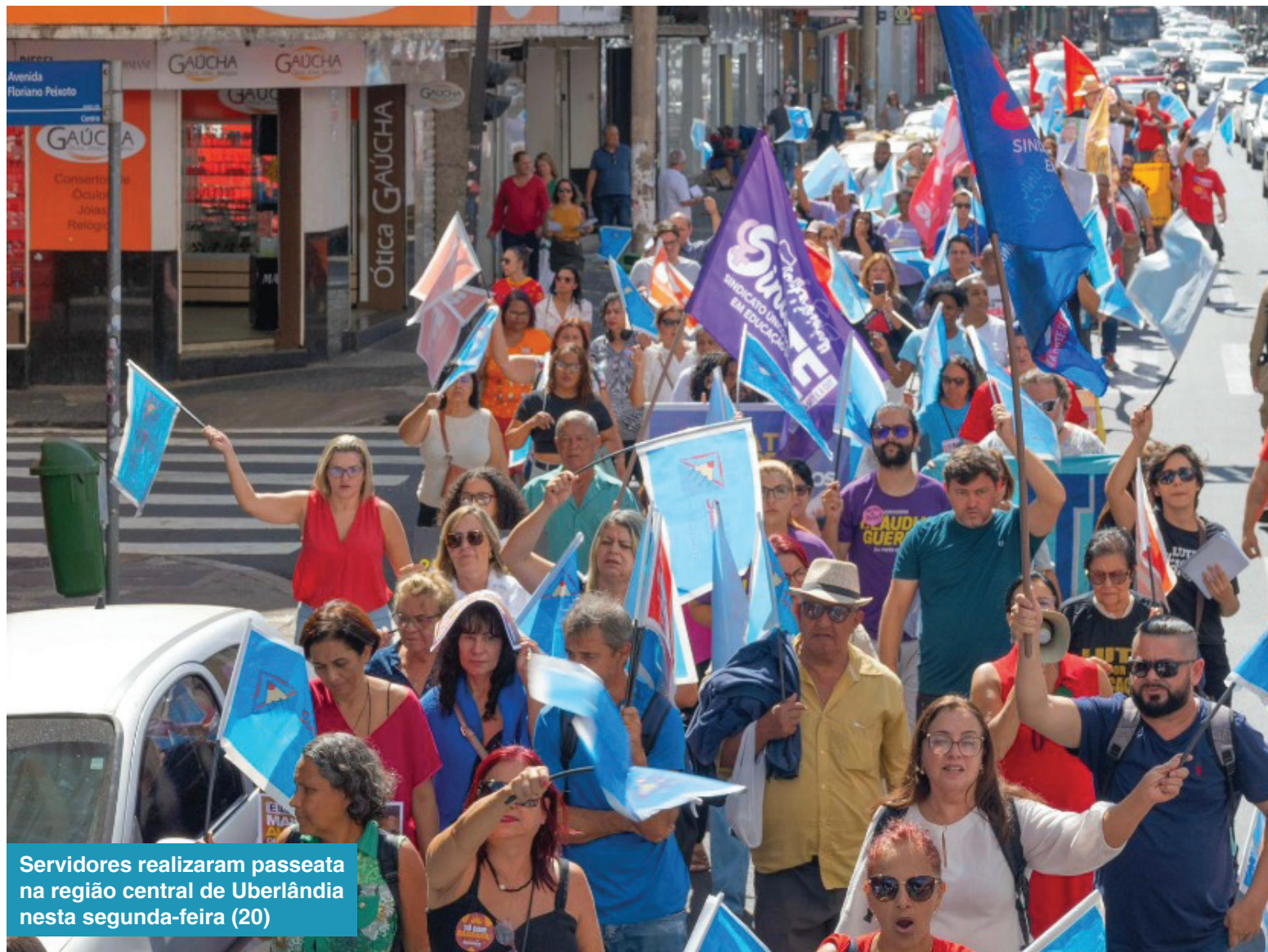
Servidores realizaram passeata na região central de Uberlândia nesta segunda-feira (20)